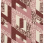
L3569_HYPER BOLE_B09_N3 024_FE