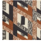
L3569_HYPER BOLE_N3013_ N3002_FE