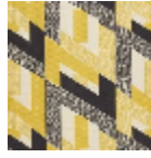
L3569_HYPER BOLE_N3002_ N3010_FE