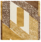
L3569_HYPER BOLE_C515_C5 12_C511_FE