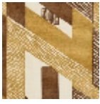
L3569_HYPER BOLE_C515_C5 12_FE