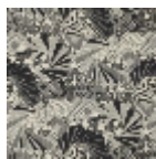
L3600_VERTIG E_B54_FE_Ver so