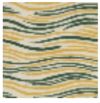
L3702_LES_ON DES_B22_B56_ FE