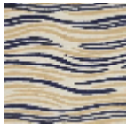
L3702_LES_ON DES_C531_C51 4_FE