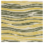
L3702_LES_ON DES_C541_N30 10_FE