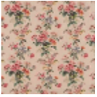
L3709001 Original 5734