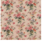
L3709001 Original 5734