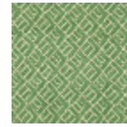
L3845_HOGGA R_N3018_FE_V ERSO