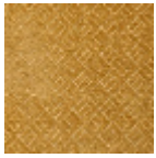
L3845_HOGGA R_C515_FI_VER SO