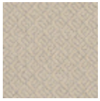
L3845_HOGGA R_B20_B06_F G