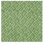
L3845_HOGGA R_N3018_FE_V ERSO