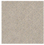
L3845_HOGGA R_B20_B06_F G_Verso