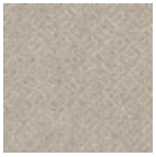
L3845_HOGGA R_B20_B06_F G_Verso