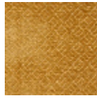
L3845_HOGGA R_C515_FB_VE RSO