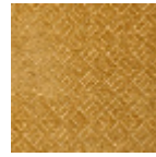
L3845_HOGGA R_C515_FI_VER SO