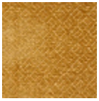
L3845_HOGGA R_C515_FB_VE RSO