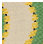
L3896_LA_RIV ERE_N3018_N3 010_B54_FE