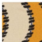
L3896_LA_RIV ERE_B58_B54_ B53_FE