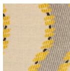
L3896_LA_RIV ERE_N3003_N 3010_B54_FE