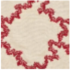
L3897_BRODE RIE_MONTESP AN_B90_FE