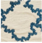
L3897_BRODE RIE_MONTESP AN_C533_FE