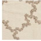
L3897_BRODE RIE_MONTESP AN_N3157_FE