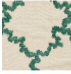
L3897_BRODE RIE_MONTESP AN_C538_FE