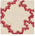
L3897_BRODE RIE_MONTESP AN_B90_FE