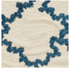
L3897_BRODE RIE_MONTESP AN_C533_FE