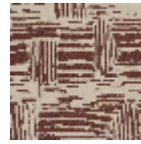
L3912_LABYRI NTHE_N3162_F G