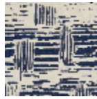
L3912_LABYRI NTHE_N3121_F E