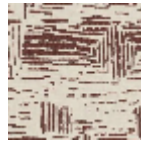
L3912_LABYRI NTHE_N3162_F E