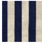
L3920_BRIGHT ON_Rayure_C5 31_FE