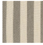
L3920_BRIGHT ON_Rayure_N3 003_FE