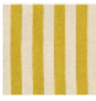
L3920_BRIGHT ON_Rayure_B7 6_FE