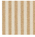
L4004_PLYMO UTH_Rayure_N 3184_FE