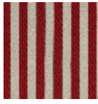
L4004_PLYMO UTH_Rayure_N 3025_FM