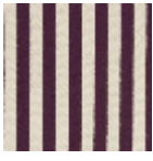
L4004_PLYMO UTH_Rayure_B 14_FE