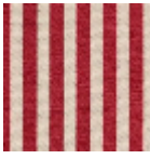
L4004_PLYMO UTH_Rayure_C 523_FE