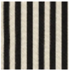
L4004_PLYMO UTH_Rayure_ B54_FE