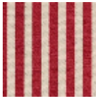
L4004_PLYMO UTH_Rayure_C 523_FE