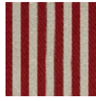
L4004_PLYMO UTH_Rayure_N 3025_FM