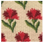
L4042_LES_OE ILLETS_Caneva s_B23_B22_B0 2_B13_FI