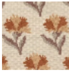
L4042_LES_OE ILLETS_Caneva s_B70_B94_B6 7_B57_FE