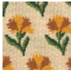
L4042_LES_OE ILLETS_Caneva s_B23_B22_B5 8_B57_FI