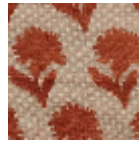
L4042_LES_OE ILLETS_Caneva s_C517_C517_C 517_C517_FM