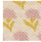
L4042_LES_OE ILLETS_Caneva s_N3017_N3017 _N3022_N3022 _FE