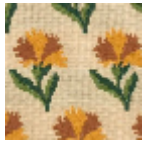
L4042_LES_OE ILLETS_Caneva s_B23_B22_B5 8_B57_FI