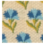
L4042_LES_OE ILLETS_Caneva s_B76_B23_B3 7_B21_FE