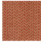
L4043_CERES_ C520_C513_VE RSO