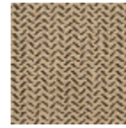
L4043_CERES_ N3002_N3004 _VERSO