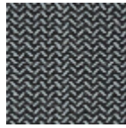
L4043_CERES_ B45_B54_VER SO