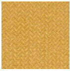
L4043_CERES_ B32_C515_VER SO