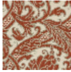
L4065_RICHEL IEU_N3013_N31 32_FE