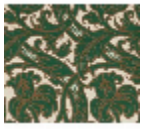
L4065_RICHEL IEU_B22_B46_ FE