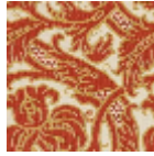
L4065_RICHEL IEU_N3175_N31 38_FE