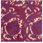
L4065_RICHEL IEU_C528_C519 _FE