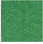
L4077_CHEVR ONS_N3016_C5 40_FE