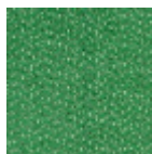
L4077_CHEVR ONS_N3016_C5 40_FE