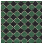
L4092_ARLEQ UIN_B54_B22_ FE