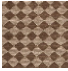
L4092_ARLEQ UIN_C511_N315 7_FE