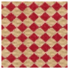
L4092_ARLEQ UIN_B90_N30 04_FE