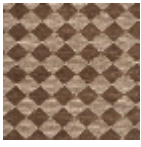
L4092_ARLEQ UIN_C511_N315 7_FE