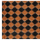
L4092_ARLEQ UIN_N3013_C5 08_FE