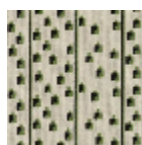
L4102_TOILE_A FRICAINE_B54 _B23_FE