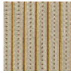
L4123_LES_PE RLES_Canevas _N3021_N3017_ FM