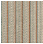
L4123_LES_PE RLES_Canevas _N3016_N3013_ FM