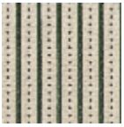
L4123_LES_PE RLES_Canevas _B54_B22_FE