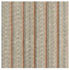
L4123_LES_PE RLES_Canevas _N3016_N3013_ FM