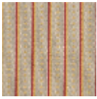
L4123_LES_PE RLES_Canevas _B56_B03_FM