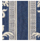
L4129_LUYNES _N3121_FE_VER SO