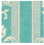
L4129_LUYNES _B73_FE_VERS O