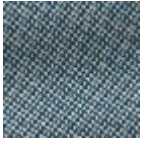
L4152_POINT_ DE_TOURS_B2 1