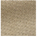
L4152_POINT_ DE_TOURS_B1 9