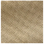
L4152_POINT_ DE_TOURS_B4 0