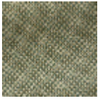
L4152_POINT_ DE_TOURS_B3 1