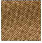
L4152_POINT_ DE_TOURS_B2 8