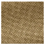
L4152_POINT_ DE_TOURS_B0 8