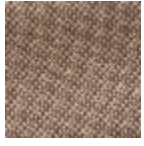
L4152_POINT_ DE_TOURS_B1 5