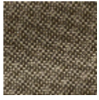
L4152_POINT_ DE_TOURS_B6 9