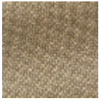
L4152_POINT_ DE_TOURS_B7 0