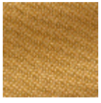
L4152_POINT_ DE_TOURS_B5 8