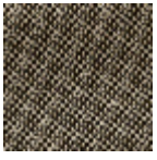
L4152_POINT_ DE_TOURS_B5 4