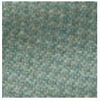
L4152_POINT_ DE_TOURS_B3 7