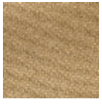
L4152_POINT_ DE_TOURS_B6 7