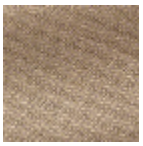
L4152_POINT_ DE_TOURS_B0 5