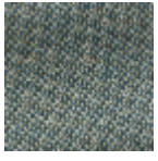
L4152_POINT_ DE_TOURS_B3 9