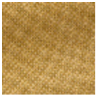
L4152_POINT_ DE_TOURS_B5 6