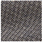
L4152_POINT_ DE_TOURS_B3 8