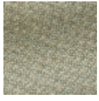
L4152_POINT_ DE_TOURS_B3 0