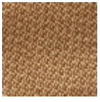
L4152_POINT_ DE_TOURS_B5 7