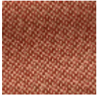
L4152_POINT_ DE_TOURS_B1 7