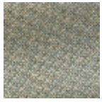
L4152_POINT_ DE_TOURS_B4 5