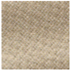
L4152_POINT_ DE_TOURS_B8 8