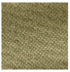
L4152_POINT_ DE_TOURS_B9 1