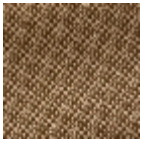
L4152_POINT_ DE_TOURS_B4 6