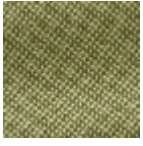
L4152_POINT_ DE_TOURS_B2 3