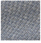
L4152_POINT_ DE_TOURS_B4 2