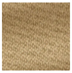
L4152_POINT_ DE_TOURS_B9 5