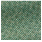
L4152_POINT_ DE_TOURS_B7 3