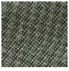
L4152_POINT_ DE_TOURS_B6 5