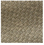
L4152_POINT_ DE_TOURS_B7 1