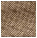
L4152_POINT_ DE_TOURS_B9 4