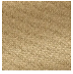
L4152_POINT_ DE_TOURS_B8 7