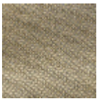
L4152_POINT_ DE_TOURS_B0 6