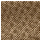
L4152_POINT_ DE_TOURS_B0 4