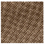
L4152_POINT_ DE_TOURS_B6 8