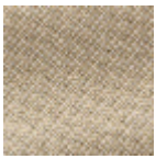
L4152_POINT_ DE_TOURS_B8 8