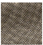
L4152_POINT_ DE_TOURS_B9 3