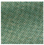
L4152_POINT_ DE_TOURS_B7 3