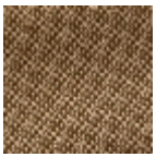
L4152_POINT_ DE_TOURS_B4 6