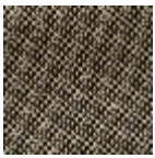
L4152_POINT_ DE_TOURS_B5 4