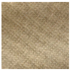
L4152_POINT_ DE_TOURS_B4 0