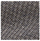
L4152_POINT_ DE_TOURS_B3 8