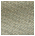
L4152_POINT_ DE_TOURS_B3 0