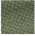
L4152_POINT_ DE_TOURS_B2 2