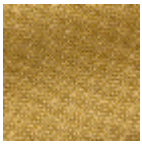
L4152_POINT_ DE_TOURS_B3 2