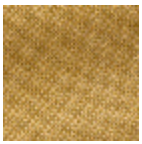
L4152_POINT_ DE_TOURS_B5 6