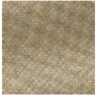
L4152_POINT_ DE_TOURS_B2 0