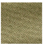
L4152_POINT_ DE_TOURS_B9 1