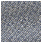
L4152_POINT_ DE_TOURS_B4 2