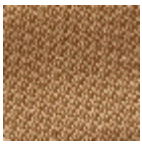
L4152_POINT_ DE_TOURS_B5 7