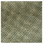
L4152_POINT_ DE_TOURS_B3 1