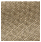
L4152_POINT_ DE_TOURS_B7 0