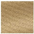
L4152_POINT_ DE_TOURS_B8 7