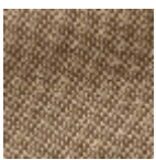
L4152_POINT_ DE_TOURS_B9 4