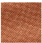
L4152_POINT_ DE_TOURS_B9 2