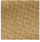
L4152_POINT_ DE_TOURS_B2 9