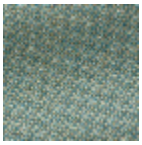
L4152_POINT_ DE_TOURS_B3 7