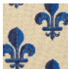
L4168_FLEUR_ DE_LYS_N3011 _N3019_FI