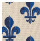
L4168_FLEUR_ DE_LYS_B38_ N3019_FE