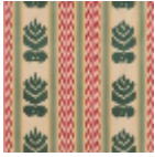
L4201002 Fleur verte