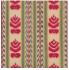
L4201001 Fleur rouge