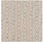
L4216003 Bleu rouge