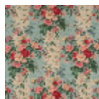
L4238001 Bleu vert