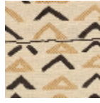
L4307_NIAME Y_N3002_N30 04_FE