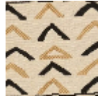
L4307_NIAME Y_N3004_B54_ FE