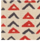
L4307_NIAME Y_B93_B02_B9 2_FE