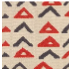
L4307_NIAME Y_B93_B02_B9 2_FE