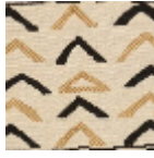
L4307_NIAME Y_N3004_B54_ FE