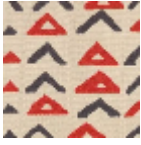
L4307_NIAME Y_B93_B02_B9 2_FE