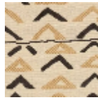
L4307_NIAME Y_N3002_N30 04_FE