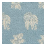
L4333_BOMBA Y_B45_FE_Ver so