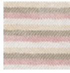
L4346_HOSSE GOR_Bayadèr e_N3008_N30 03_N3006_N30 05