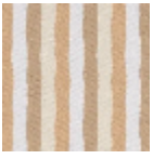
L4346_HOSSE GOR_Bayadèr e_B88_B95_B0 O_B67