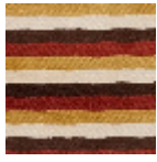
L4346_HOSSE GOR_Bayadèr e_C502_C515_C 522_C509