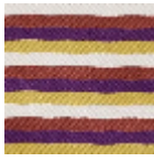
L4346_HOSSE GOR_Bayadèr e_N3005_N301 7_N3020_N302 4