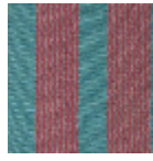
L4358_ARGEL ES_Rayure_N3 014_N3136