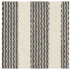
L4358_ARGEL ES_Rayure_B5 4_B00