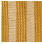
L4358_ARGEL ES_Rayure_C51 6_N3004