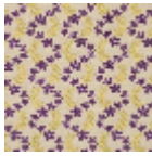
L4388_OPHELI E_N3017_N302 O_FG