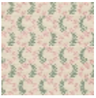
L4388_OPHELI E_B31_N3110_F E