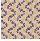
L4388_OPHELI E_N3017_N302 O_FG