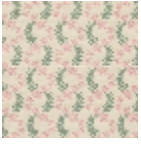
L4388_OPHELI E_B31_N3110_F E