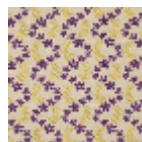
L4388_OPHELI E_N3017_N302 O_FG