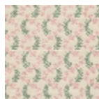
L4388_OPHELI E_B31_N3110_F E