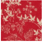
L4415_ERABLE S_B2_FE_VERS O