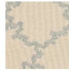
L4426_MONTE SPAN_Canevas _N3133_FE