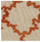
L4426_MONTE SPAN_Canevas _C517_FA