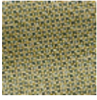
L4441_PIED_D E_POULE_B23 _B76_B23_B65