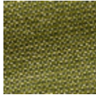
L4441_PIED_D E_POULE_C53 9_C541