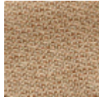
L4441_PIED_D E_POULE_N31 55_N3188