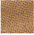
L4441_PIED_D E_POULE_B14_ B58