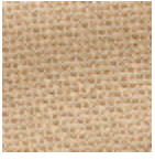
L4441_PIED_D E_POULE_B0_ B67