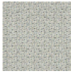
L4445_VELLAS QUEZ_N3127_ N3122_FE