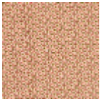
L4445_VELAS QUEZ_N3104_ C539_FE