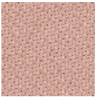
L4445_VELAS QUEZ_B09_B6 5_FE