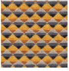
L4449_ARLEQ UIN_Multicolor e_B54_B93_B7 0_B57_B58_B5 6_FE