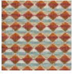
L4449_ARLEQ UIN_Multicolor e_N3021_N302 4_N3013_N302 3_N3016_N300 7_FE