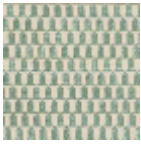
L4513_MINI_BL ASON_N3135_F E