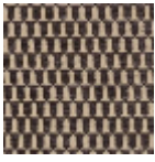
L4513_MINI_BL ASON_C507_F G