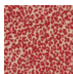
L4516_MINI_LE OPARD_B90_F G