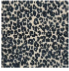
L4516_MINI_LE OPARD_C533_ FE