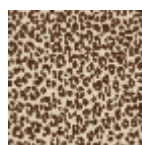
L4516_MINI_LE OPARD_N3159 _FE