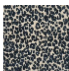
L4516_MINI_LE OPARD_C533_ FE