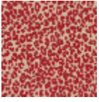
L4516_MINI_LE OPARD_B90_F G