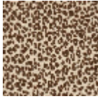
L4516_MINI_LE OPARD_N3159 _FE