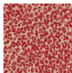
L4516_MINI_LE OPARD_B90_F G