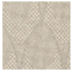
L4519_ZELDA_ B20_FE_VERS O