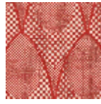
L4519_ZELDA_ N3103_FE_VERS O