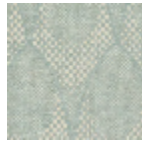
L4519_ZELDA_ C537_FE_VERS O